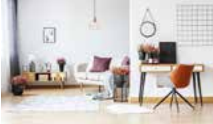
Abb. kann von der endg. Ausführung abweichen.